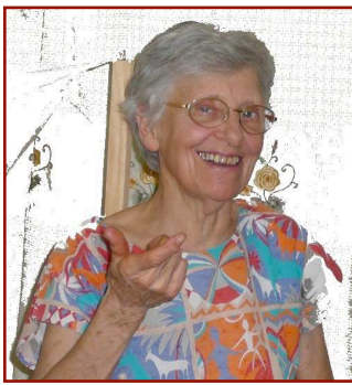
Niamey Août 2008